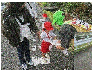
シールを もらったよ

6月の「田んぼで泥遊び」に続き、地域の方々のご協力で実現した季節の遊び親子でいろいろなポイントを通り、最後はみかん狩り。いいお天気でよかったです。