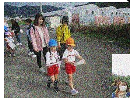
友だちと一緒に 地図を見て